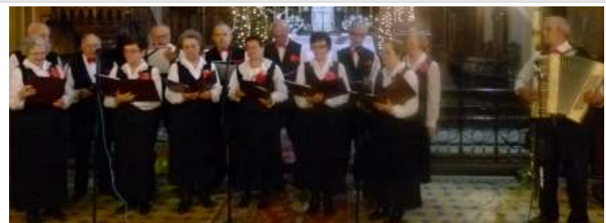
Zespół Śpiewaczy „Seniorzy”