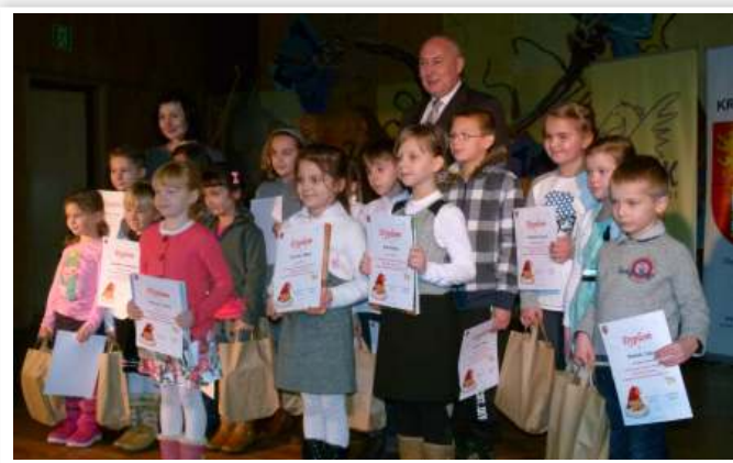
Laureaci konkursu plastycznego w kat. klas I-III