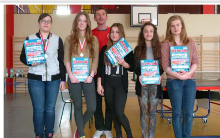
Zwycięzcy gr. II dziewczyny