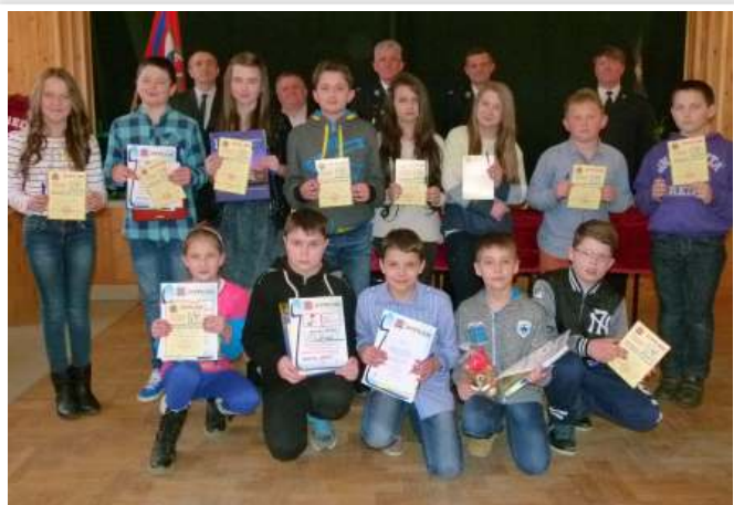
Uczestnicy turnieju w kat. kl. IV-VI SP