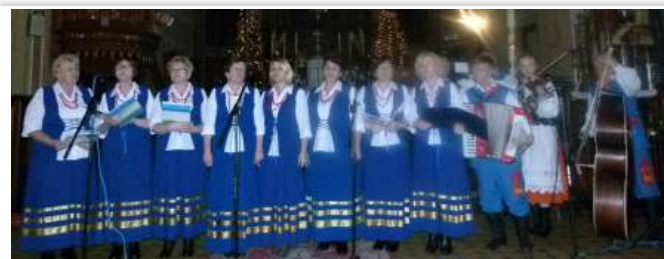
Zespół Śpiewaczy „Bobrzanie” z Kapelą Ludową