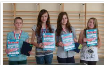
Zwycięzcy gr. I dziewczyny