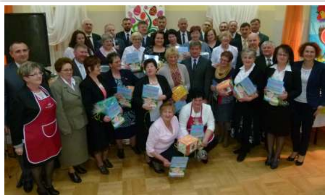
Przewodniczące KGW oraz zaproszeni goście