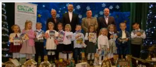
Uczestnicy konkursu w kat. przedszkole, klasy 0