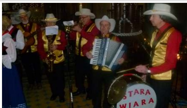
Kapela Podwórkowa „Stara Wiara”