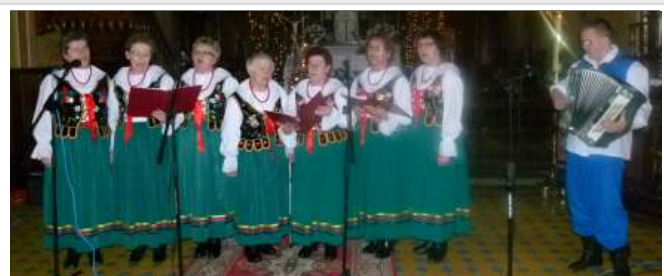
Zespół Śpiewaczy „Wietrznianki”