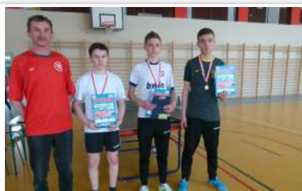
Zwycięzcy gr. II chłopcy