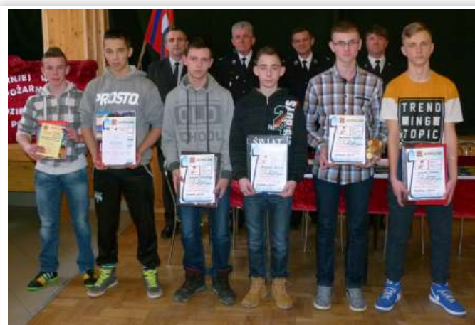
Uczestnicy turnieju w kat. gimnazja