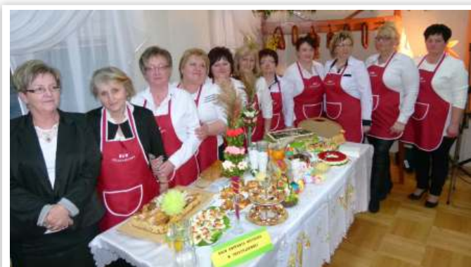
Koło Gospodyń Wiejskich w Szczepańcowej