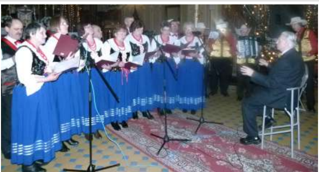
Zespół Śpiewaczy „Nadzieja”