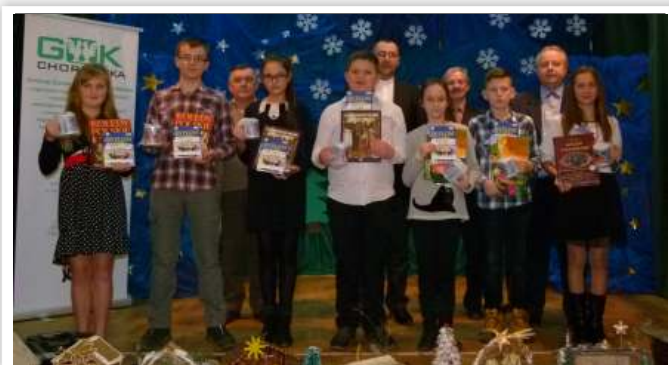
Laureaci w kat. kl. IV - VI i gimnazja