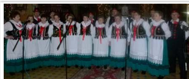
Zespół Śpiewaczy „Chorkowianie”