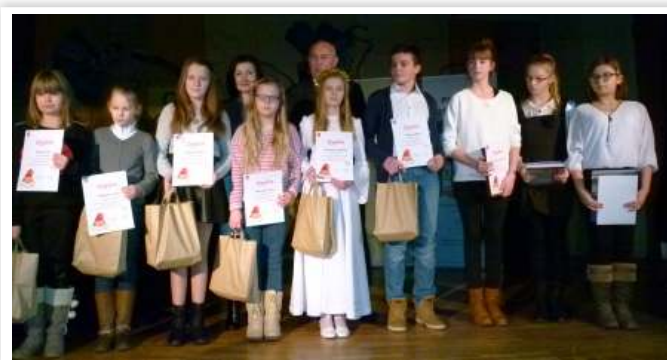
Laureaci konkursu plastycznego w kat. klas IV-VI