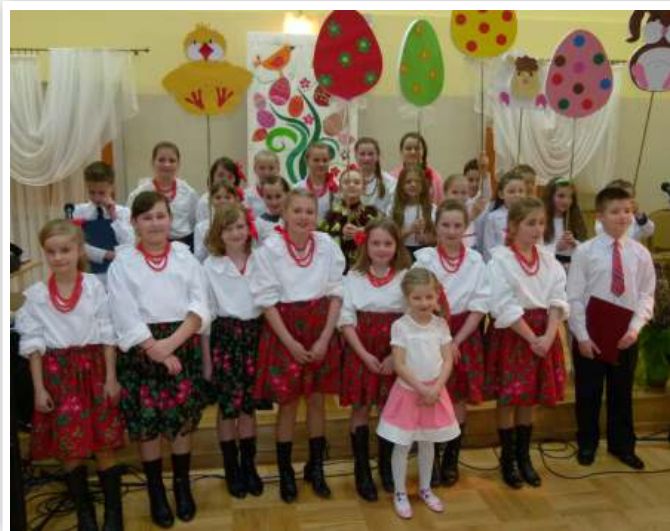
Uczniowie SP w Szczepańcowej