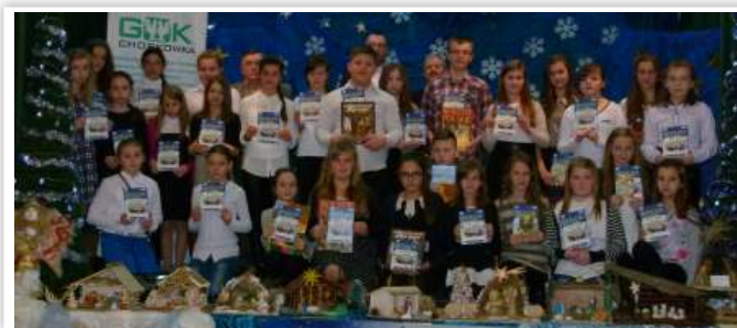
Uczestnicy konkursu w kat. klas IV - VI