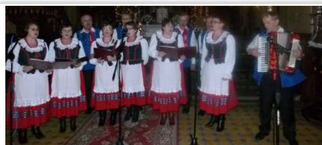
Zespół Śpiewaczy „Jutrzenka”