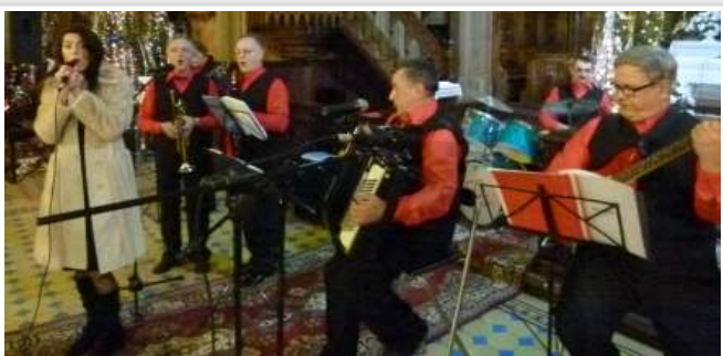
Zespół „50 Plus”