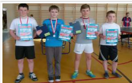
Zwycięzcy gr. I chłopcy