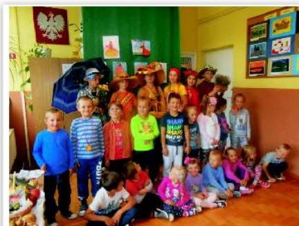
Uczniowie Szkoły Podstawowej w Leśniówce