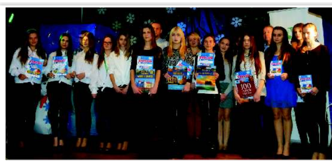
Uczestnicy w kat. klas gimnazjalnych i ponadgimnazjalnych