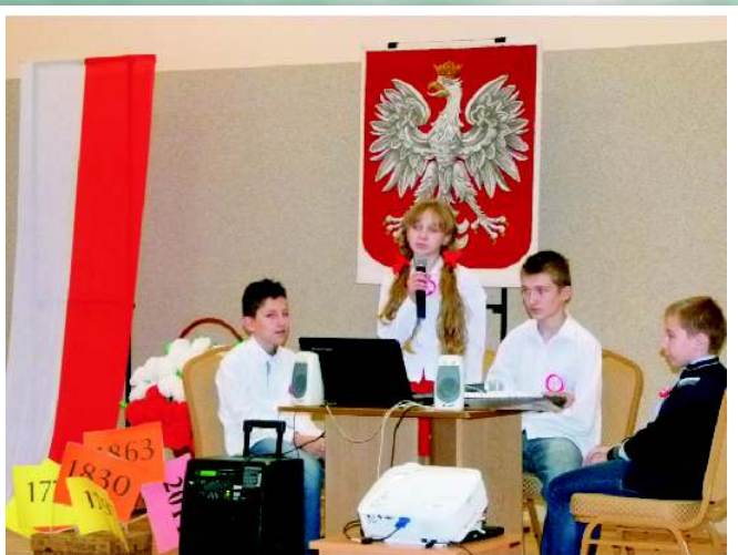
Część artystyczna w wykonaniu uczniów SP w Żeglach