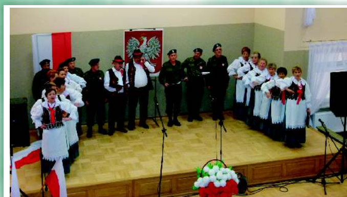
Zespół Śpiewaczy „Chorkowianie” z Chorkówki