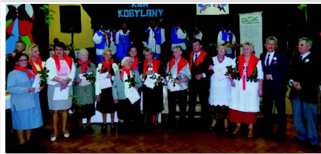
Seniorki uczestniczące w działalności KGW wraz z zaproszonymi gośćmi