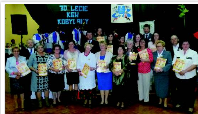
Przewodniczące KGW wraz z zaproszonymi gośćmi