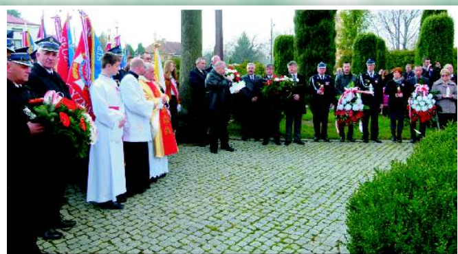
Składanie wieńców pod pomnikiem przy kościele