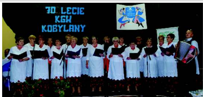
Część artystyczna w wykonaniu KGW w Kobylanach