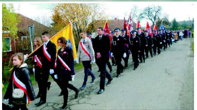
Przemarsz z kościoła do sali Domu Ludowego w Żeglach