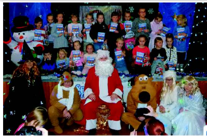
Zespół Taneczny „Mini Stokrotki”

Okres świąteczny, to czas radości i wielkich marzeń wszystkich dzieci. Tegoroczna nietypowa aura nie zmyliła Świętego Mikołaja. Pomimo braku śniegu 5 grudnia Mikołaj zawiązał do Gminnego Ośrodka Kultury w Chorkówce. Czas oczekiwania na przybycie Mikołaja wypełniło przedstawienie „Królewna Śnieżka i siedmiu krasnoludków” w wykonaniu aktorów Agencji Artystycznej ART-RE z Krakowa. Zaraz po zakończeniu przedstawienia przybył Św. Mikołaj i wręczył wszystkim