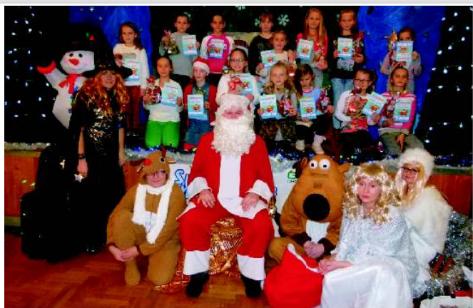
Zespół Taneczny „Stokrotki”