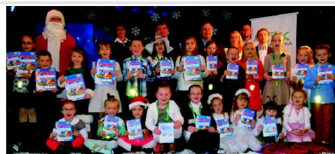
Uczestnicy w kat. klas 0-III szkół podstawowych