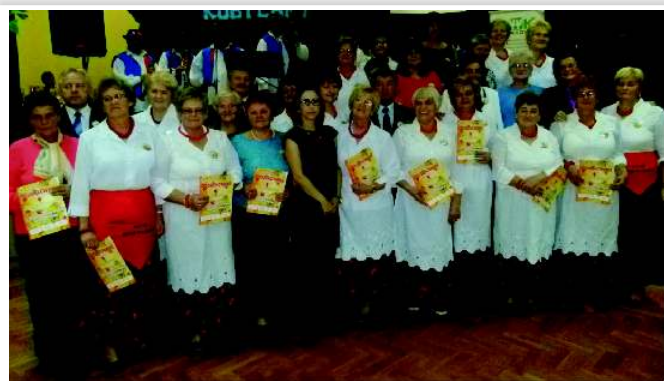
Organizatorzy uroczystości - KGW w Kobylanach z władzami samorządowymi