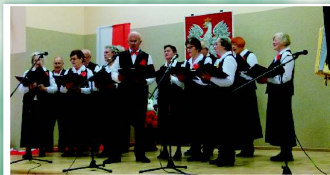
Zespół Śpiewaczy „Seniorzy” ze Świerzowej P.