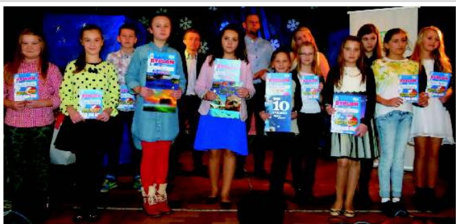
Uczestnicy w kat. klas IV-VI