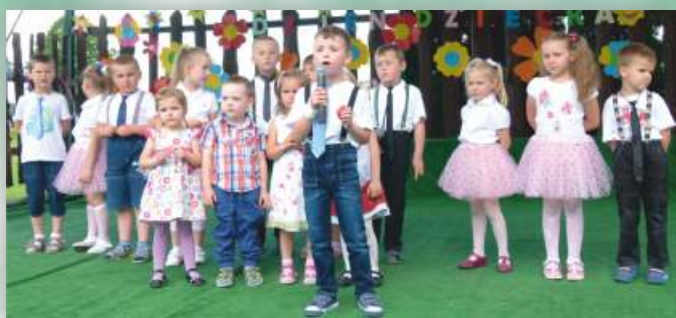
Część artystyczna w wykonani dzieci z Sam. Przedszkola w Chorkówce