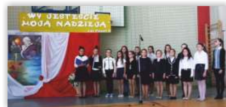
Występ uczniów ZSP w Kopytowej