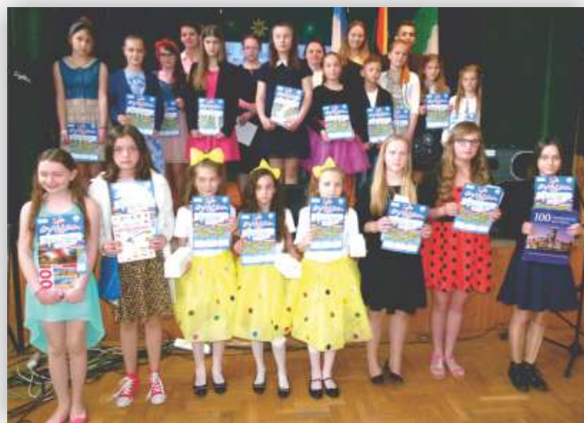
Uczestnicy w kat. klas IV-VI

Kategoria gimnazja: I miejsce: Zespół muzyczny „SONG” (Publiczne