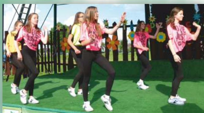
Zespół Taneczny „Day Stars”