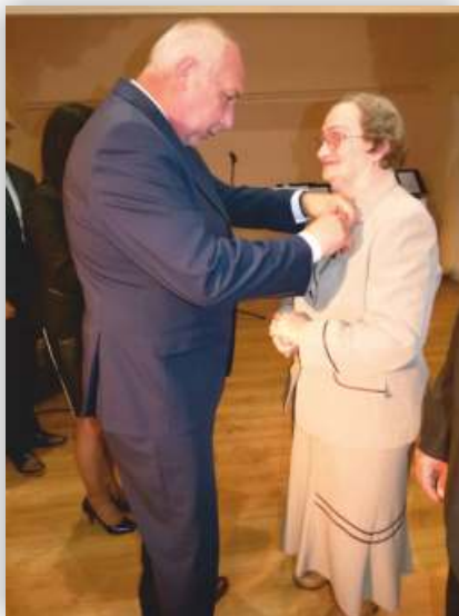
GOK w Chorkówce