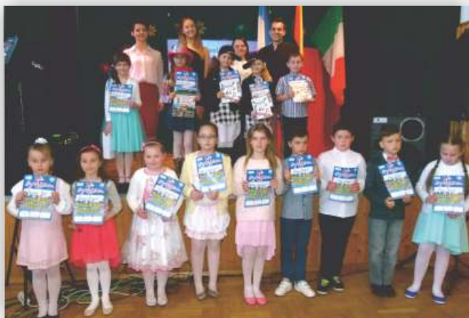
Uczestnicy w kat. klas I-III