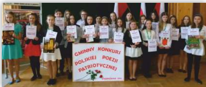
Uczestnicy konkursu w kat. SP kl. IV-VI

Laureaci etapu gminnego konkursu wzięli udział w X Powiatowym Konkursie Recytatorskim Polskiej Poezji Patriotycznej, który odbył się 21 kwietnia 2016 r. w Inter-nacie ZS w Iwoniczu. ◀