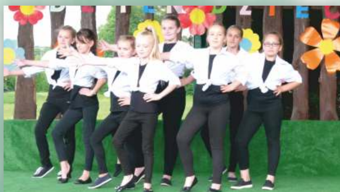
Zespół Taneczny „Stokrotki”