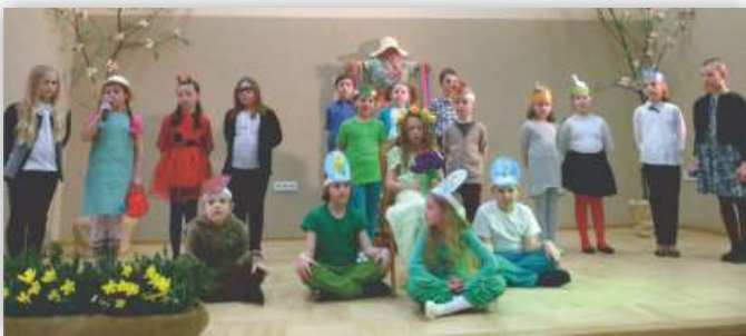
Występ dzieci z SP w Żeglach