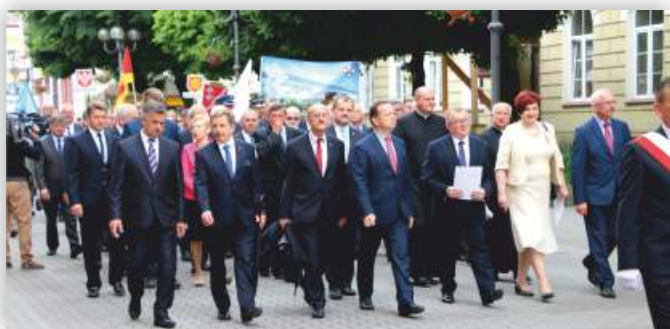
Parada z okazji Dnia Samorządowca