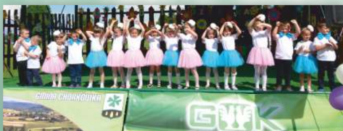
Występ dzieci z Niepublicznego Przedszkola „Misiowo”