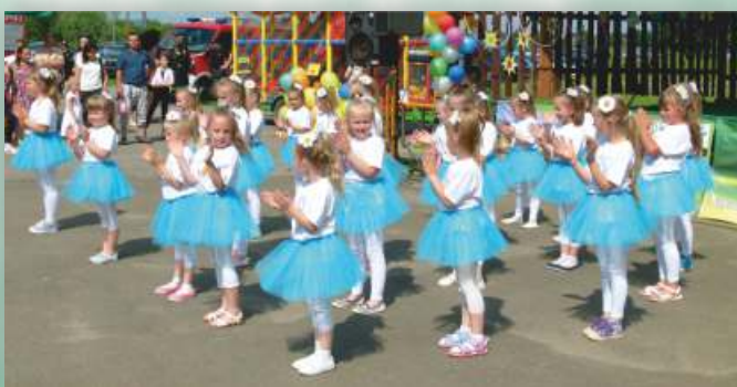
Dzieci z Zespół Taneczny „Mini Stokrotki”