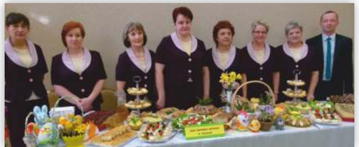
KGW w Żeglach wraz z sołtysiem