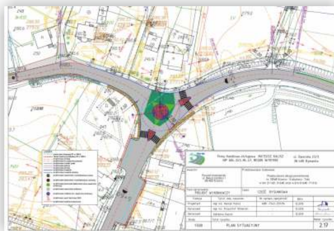
Planowane rondo przy budynku urzędu gminy

18 lutego br. na stronie internetowej Gminy Chorkówka informowaliśmy o tym, że Starostwo Powiatowe w Krośnie złożyło wniosek o dofinansowanie zadania polegającego na przebudowie drogi powiatowej Nr 1896R Krosno - Kobylany - Toki w km 3+160 - 3+956, km 4+640 - 7+316 tj. ul. Krośnieńskiej od mostu na Jasiołce w Świerzowej Polskiej do skrzyżowania ul. Łukasiewicza z ul. Kościelną w Zręcinie oraz od skrzyżowania ulic Łukasiewicza i Bieszczadzkiej w Zręcinie w stronę Chorkówki - do skrzyżowania w Chorkówce na Bóbrkę. Wniosek został złożony w ramach Programu Rozwoju Obszarów Wiejskich na lata 2014-2020. 7 czerwca 2016 r. Zarząd Województwa Podkarpackiego podjął uchwałę w sprawie zatwierdzenia listy operacji w ramach poddziałania „Wsparcie inwestycji związanych z tworzeniem, ulepszaniem lub rozbudową wszystkich rodzajów małej infrastruktury, w tym inwestycji w energię odnawialną w oszczędzanie energii” na operacje typu „Budowa lub ▶