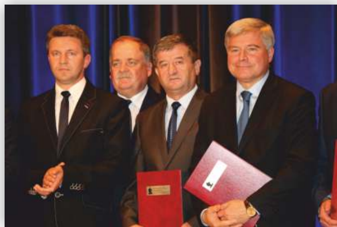
Nominowani do nagrody