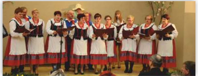
Zespół Śpiewaczy „Jutrzenka”