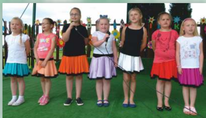
Występ dzieci z ZS w Chorkówce